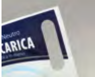
Grifföffnung an der Ecke