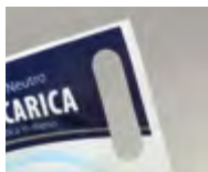
Grifföffnung an der Ecke